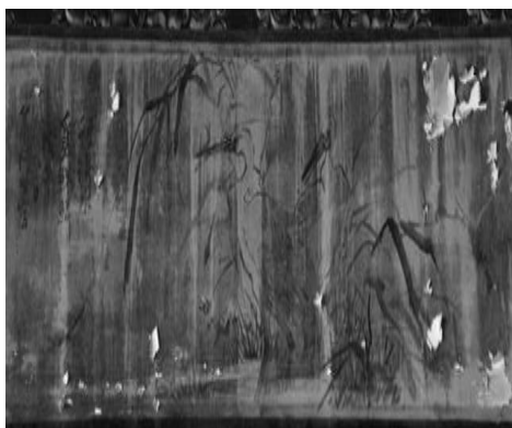
圖 34：新北市三重區先嗇宮

當然，有些浮雕的花鳥題辭，也未必是究極與理想之題辭，尤其是晚近許多新題辭都不知花鳥題辭使用的雙關、諧音、典故等，而直接拼湊花鳥，如新北市九份福山宮的浮雕題字「荷塘白鷺」，就不如原先所具有的「一路連科」與「荷塘清趣」具有更深的文化意蘊了。此外，新莊地藏庵(大眾廟)的新花鳥石刻，荷塘中立一白鷺的直幅構圖，題辭為「夏蓮單思」，雖然新穎，卻令人咋舌，因為舊有的三隻鷺鷥以喻行事要三思，如明代呂紀〈三思圖〉，並未有單戀的苦澀情愛寓意，因而，也不如原先的「一路連科」與「荷塘清趣」具有更深內涵。倒是新北市三重先嗇宮戊午(1979)署名臺南阿生(陳