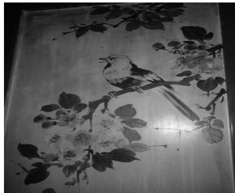
圖 18：臺北市萬華區青山宮