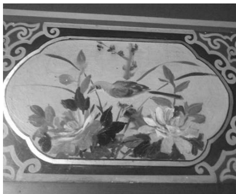
圖 25：臺北市萬華區龍山寺