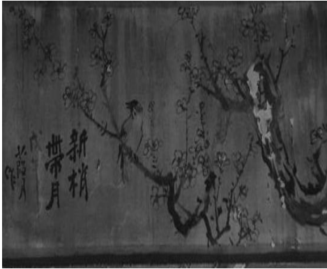
圖 13：新北市三重區先嗇宮