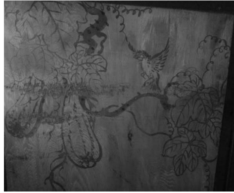
圖 30：新北市新莊區慈祐宮