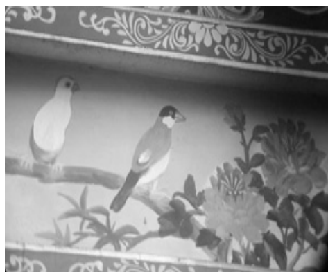
圖 42：新北市新莊區慈祐宮