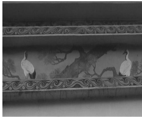
圖 16：新北市新莊區慈祐宮