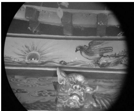
圖 31：臺北市大同區大龍峒保安宮