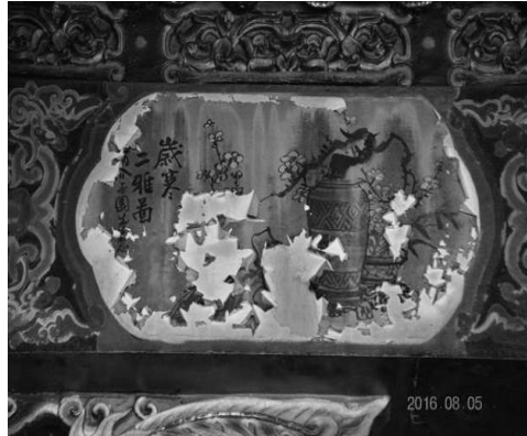
圖 36：新北市三重區先嗇宮