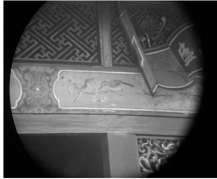
圖 20：臺北市萬華區龍山寺