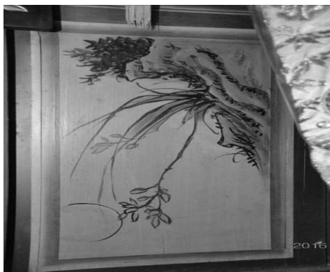
圖 40：新北市三重區先晉宮