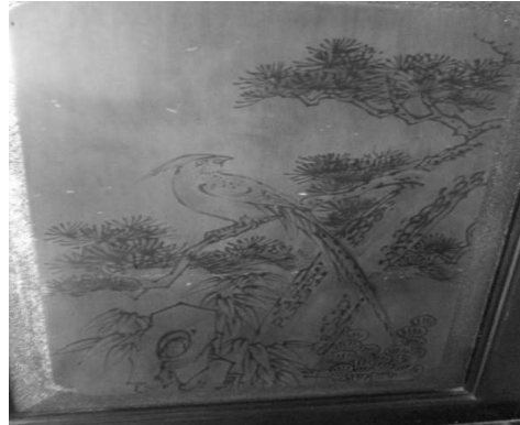
圖 14：新北市新莊區慈祐宮