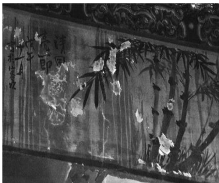
圖 47：新北市三重區先嗇宮