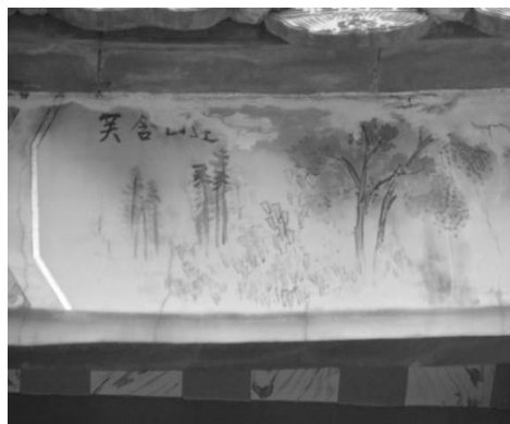
圖 8：新北市新莊區慈祐宮

4. 新北市新莊慈祐宮彩繪題字「鳥語花香」(圖 9)，枝頭雙鳥與含苞的花卉合繪。此外，新北市新莊中山路與雙鳳路口的小土地廟「福正宮」，除了六角亭頂彩繪八仙的宗教傳說人物