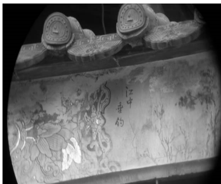
圖 10：新北市新莊區慈祐宮

6. 新北市三重先嗇宮花鳥雕刻題字「放鶴喬松下，優悠天地寬」，落款為大正十五年(1926)；另一幅題字「書就黃庭日，籠鵝得意歸」，同樣有落款「丙寅夏」，也是 1926 年的石雕，紀年方式與石雕方式與風格的不同，看來是不同派別的石雕創作。內容都是悠遊天地間，以書法為樂，以放鶴養鵝為樂，有仙道出塵之思，也有醉心於書法創作之意，都逸出於吉祥寓意的俗套。