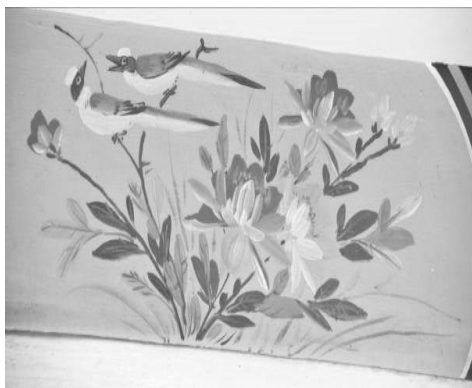
圖 23：新竹峨眉富興老街福德宮