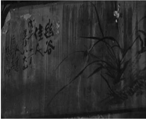
圖 35：新北市三重區先嗇宮