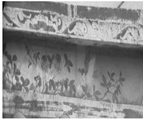
圖 22：新北市新莊區慈祐宮

3. 新竹峨眉富興老街福德宮的涼亭上的彩繪，畫有白頭翁與紅黃雙色的牡丹花(圖 23)，同樣可以題上「富貴白頭」的標準祝賀語，可惜卻付諸闕如，應該是所承傳處未作題字，所以沒有題款。