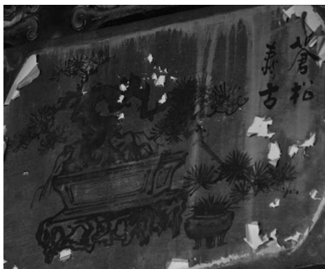
圖 44：新北市三重區先嗇宮