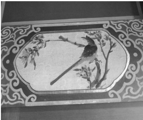
圖 21：臺北市萬華區龍山寺