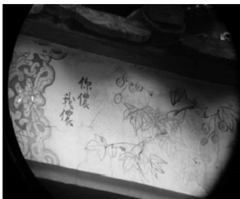
圖 11：新北市新莊區慈祐宮