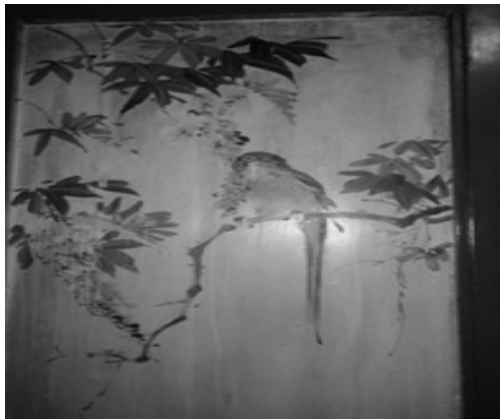
圖 37：臺北市萬華區青山宮

的紫藤花鳥等未題辭彩繪，如果參酌《三希堂畫寶》，可以發現早有「春林紫雪」的題辭，可供補充寺廟彩繪無辭可用的窘境。