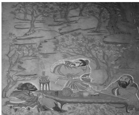
圖 38：臺北市大同區大龍峒保安宮