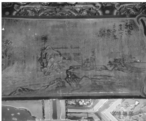
圖 7：新北市三重區先嗇宮