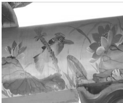
圖 28：新北市三重區先嗇宮