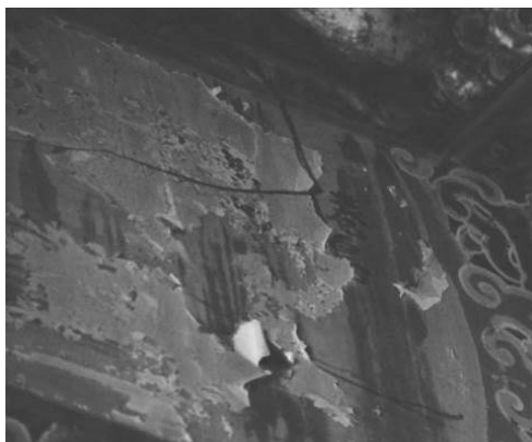
圖 53：新北市三重區先嗇宮

推敲，約略推測出「倦鳥歸巢」；或參考彰化鹿港龍山寺郭新林所作彩繪「風枝倦鳥猜」的構圖，以五字詩句作題詞。這都要歸功於花鳥彩繪題詞的研究，才能快速的找到修復的構圖與題詞參考。