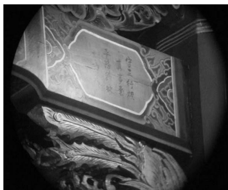
圖 43：臺北市萬華區青山宮

浮雕題字「香遠益清，亭亭淨植」， 49 證明了「香遠益清」的題辭正誤所在。而這四字又是出自於宋代周敦頤的〈愛蓮說〉首段：「水陸草木之花，可愛者甚蕃。晉陶淵明獨愛菊，自李唐來，世人盛愛牡丹。予獨愛蓮之出淤泥而不染，濯清漣而不妖；中通外直，不蔓不枝；香遠益清，亭亭淨植，可遠觀而不可褻玩焉。」 50 這樣看來，四字的題辭有時也未必板重，而能上溯其文