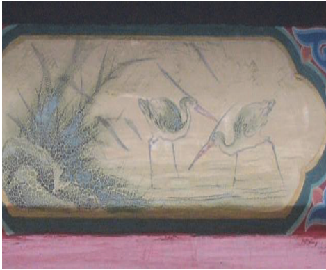
圖 49：臺北市萬華區龍山寺