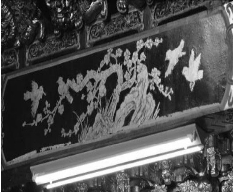
圖 3：新北市三重區先嗇宮