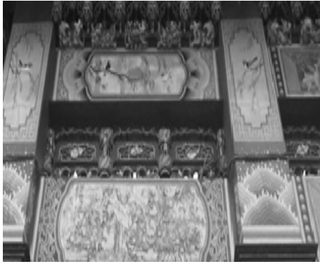
圖 1：嘉義縣民雄鄉大士爺廟