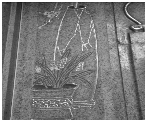
圖 39：臺北市萬華區青山宮

3. 臺北市萬華青山宮石雕百合科的萬年青，將果實以金色上彩(圖 39)，是一種失誤，其實萬年青的肉質果熟時為紅色。總之，將寺廟當中有關花鳥構圖的樣貌與色彩，不管是木雕、石雕、磚雕等材質，都可與花鳥彩繪有一相互參照的作用，保持其彩繪的準確度。