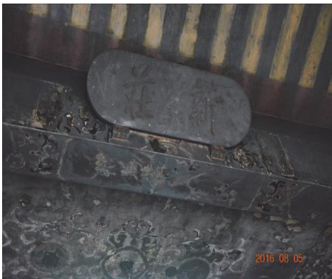
圖 51：新北市新莊區福德宮