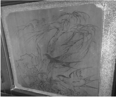
圖 29：新北市新莊區慈祐宮