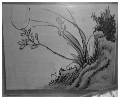
圖 41：新北市三重區先晉宮