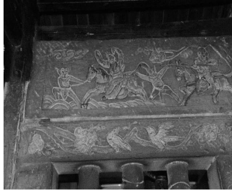
圖 2：新北市瑞芳區九份福山宮

色不是白的，有時又會有紅底或是褐黃底色的不同，總之，素底黑墨線描繪，是早期物資缺乏時，彩繪的樸素階段。舉例如下：