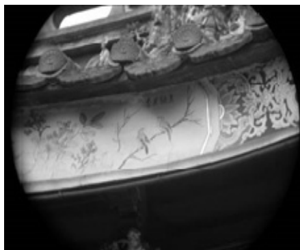
圖 9：新北市新莊區慈祐宮