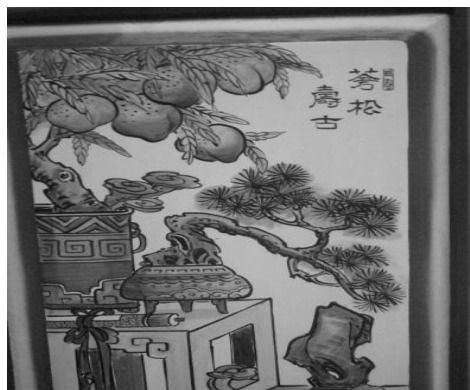
圖 45：新北市三重區先嗇宮