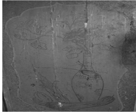
圖 4：新北市新莊區廣福宮