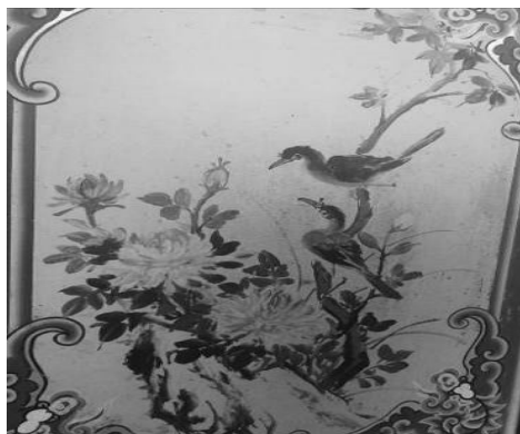
圖 26：臺北市萬華區龍山寺