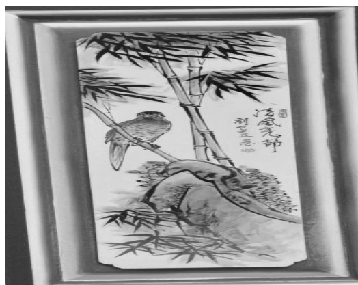
圖 48：新北市三重區先嗇宮

低，不會讓名山大業沒落，減損其藝術價值，也就不必讓研究者在事後校正時感嘆寺廟花鳥彩繪的沒落。