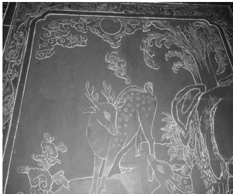
圖 5：臺北市萬華區清水巖

圖；9.宗教儀式圖；10.祥瑞圖（吉祥圖案、吉祥繪畫、山水風景）；11.將（八班、黑白無常）；12.其他（唐詩圖等無法列入以上類別的）。 6 有關本文所側重的花鳥彩繪，其主題「花鳥」未見羅列，似乎只能勉強歸入 10.「祥瑞圖」，以及 12.「其他」，在分類中這樣一語帶過，證明了花鳥彩繪的主題是長期被研究者所忽略的。其原因在於花鳥畫的發展在近代沉寂，遠不及山水畫受到重視，積重難返。而且，相較於歷史演義與宗教傳承，明晰可辨，花鳥畫沒