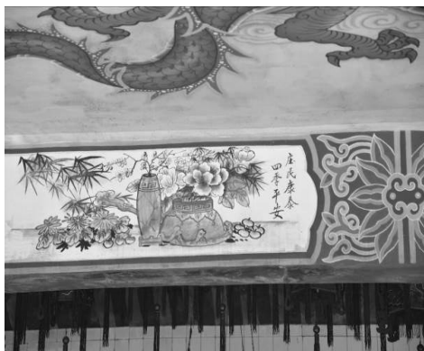
圖 6：新竹縣峨眉鄉富興老街福德宮

3. 彰化鹿港薛王府也有一幅「松鶴延齡」彩繪，本幅題字後有落款為彩繪師「劉家正」的作品。