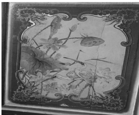
圖 27：臺北市萬華區龍山寺