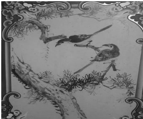
圖 15：臺北市萬華區龍山寺