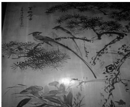
圖 46：臺北市萬華區青山宮