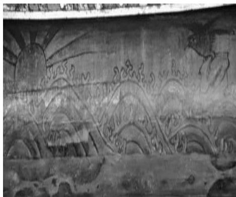
圖 32：新北市新莊區慈祐宮