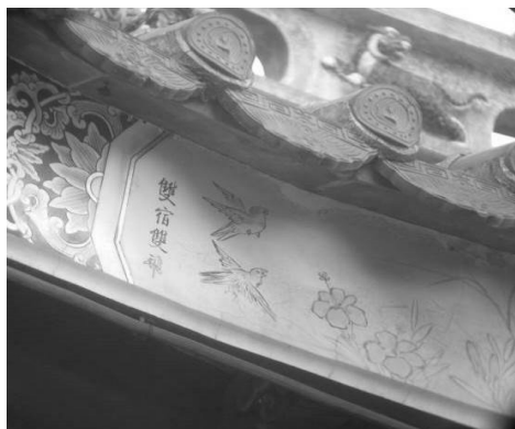
圖 12：新北市新莊區慈祐宮

的，則題為「清風亮節」、而繪有蓮花的，則題為「藕花未冷水風清」、繪有蘭花的，則題為「幽谷佳人」、繪有菊鳥的，則題為「秋色秋聲」、繪有月下梅雀的，則題為「新梢帶月」(圖 13)。這些題詞，不但改變我們對於花鳥彩繪鮮少題詞的印象，也完全顛覆了我們印象中只有吉祥取喻的題詞俗套。 27 可見花鳥彩繪題原來在字數、內容上是豐富多變的，題字漸少或付諸闕如，實是傳承的源頭漸失，而產生了斷層問題。