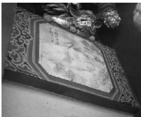
圖 33：嘉義縣北港鎮朝天宮